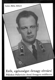
Szűcs Béla Albert Erőt, egészséget őrnagy elvtárs! Pálinkás-Pallavicini Antal őrnagyra emlékezve 2014.

A könyv "Erőt, egészséget őrnagy elvtárs! Pálinkás-Pallavicini Antal őrnagyra emlékezve" címet kapta. Az író nagyon színesen, életszerűen mutatta be az akkori laktanyai életet, de nem felejtette ki azt sem, hogy megemlítsé, milyen kis település volt akkor még Rétság. "Egy perces" településnek nevezték el a katonák, mivel egy perc alatt át lehetett haladni rajta. A katonávevőiről, itteni személyes élményeiről szól ez a könyv, és dokumentumokkal alátámasztva mutatja be Pálinkás-Pallavicini Antal őrnagy, a tragikus sorsú katonatiszt életútját akit az 1956-os forradalom és