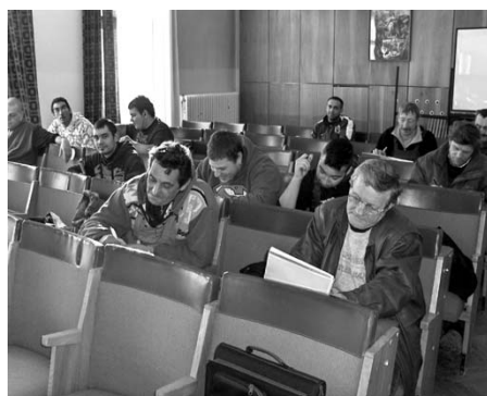
Képzés a tanteremben és a gyakorlatban

A projekt keretében 2011 őszén öt tanfolyamot indított a Nógrád Megyei Kormányhivatal Munkaügyi Központja a rétsági és a balassagyarmati kirendeltséggel közösen, egyet pedig saját szervezésben, rétsági helyszínnel. A balassagyarmati tanfolyamok közül már két képzés befejeződött, térségünkben négy fő Pályázatíró és projektmenedzser, öt fő pedig Társadalombiztosítási ügyintéző szakképzett séget szerzett. Jelenleg folyamatban van