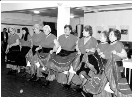
A Városi Nyugdíjas Klub táncosai gyakorta fellépnek a civil szervezetek programjain.