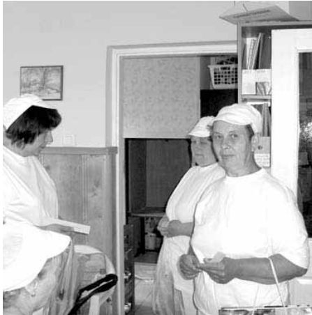
Pillanatképek a konyhai kisegítő vizsgáról. Túl a tételhúzáson

Ebben a hónapban két képzés is befejeződött, mely a Társadalmi Megújulás Operatív Program keretében szerveződött. Július 5-én zárult a Nehézgépezelő és a