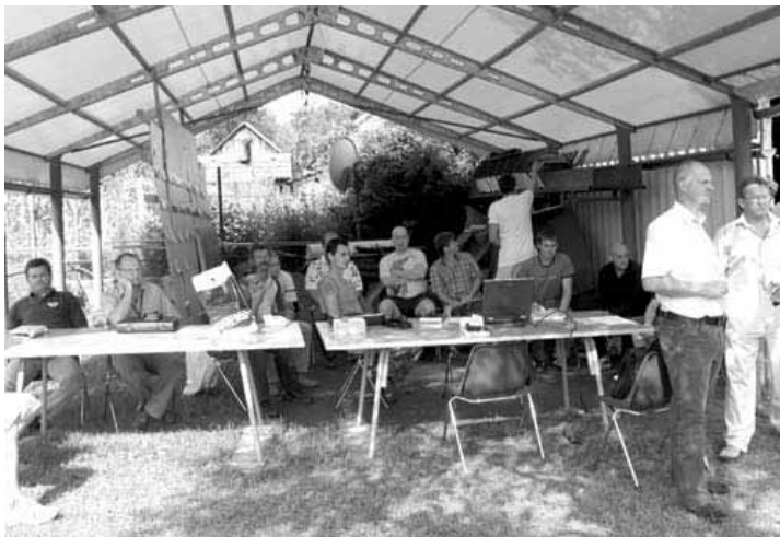
A várakozás nehéz percei