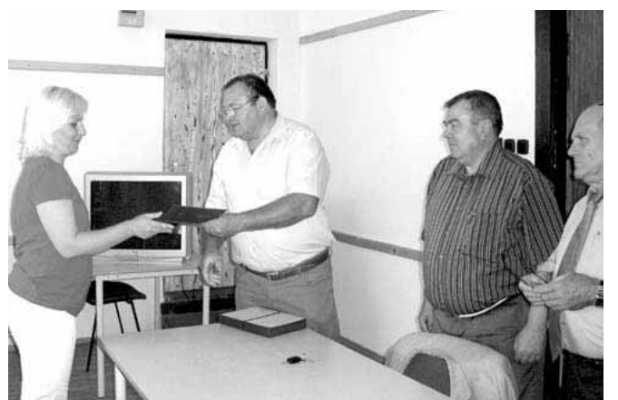
A megérdemelt munka jutalma